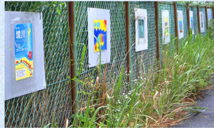
町田側の中村橋付近のフェンス de ギャラリー(撮影:2013-7-17)