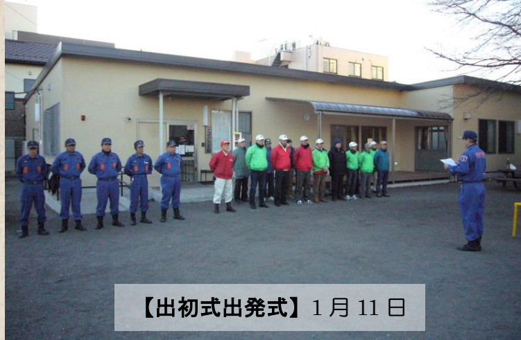
【出初式出発式】1月11日