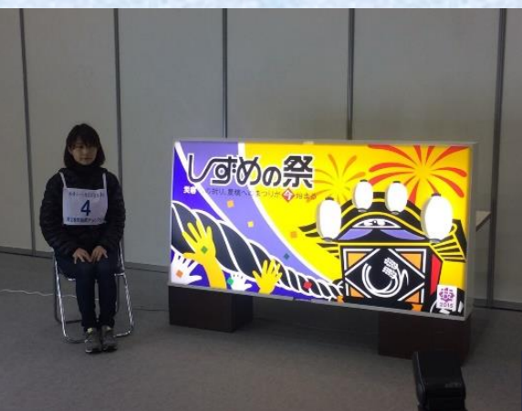
作品名「しずめの祭」

「粘着シート仕上げ広告美術」とはシートのカッティング技術を駆使して広告看板を作るもので、今年度の課題テーマは「祭り」。日常生活の中で発生する自然災害を鎮め、豊穡を願う「日本の祭」を表現し2日間10時間かけて制作した作品です。