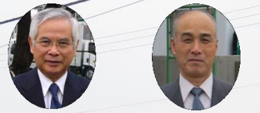
石井会計監査 赤松会計監査