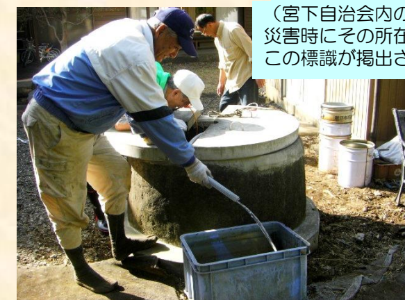
▲災害等による断水時に活躍する井戸のテスト風景

この井戸水はそのままでは飲めません。ご自宅にも飲料水を備えましょう。また、災害はいつ起こるか分かりません。この災害時協力井戸をはじめ、私たちの住んでいる地域のことを改めてよく知り、地域ぐるみ、自治会ぐるみで、災害に備えましょう。