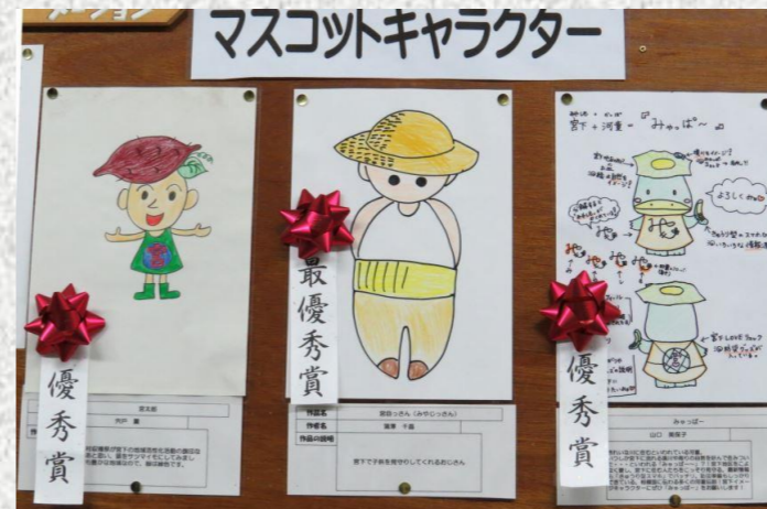
麦わら帽子がかわいいキャラクターですね!