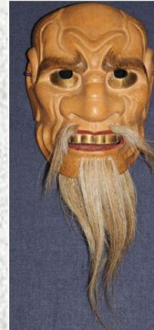
作品名「鼻瘤悪劇」 (はなこぶあくじょう)