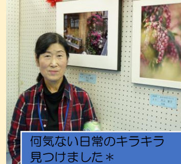
何気ない日常のキラキラ見つけました*