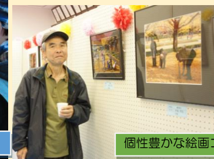
個性豊かな絵画コーナー