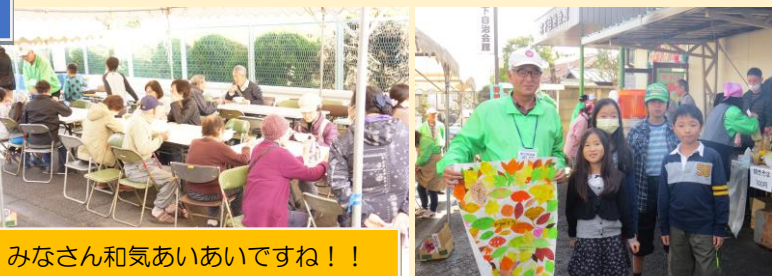
みなさん和气あいあいですね！！