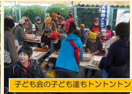
子ども会の子も達もトントントン