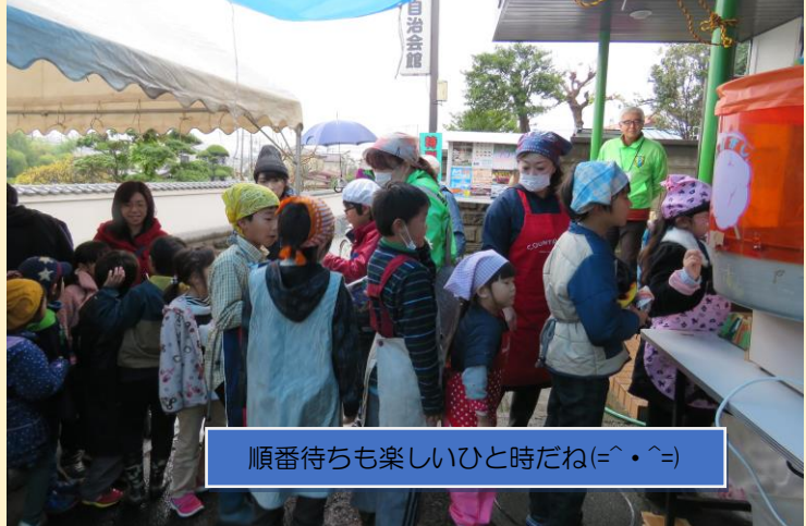
順番待ちも楽しいひと時だね(=^・^=)