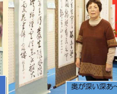
奥が深い深あ〜い書道コーナー