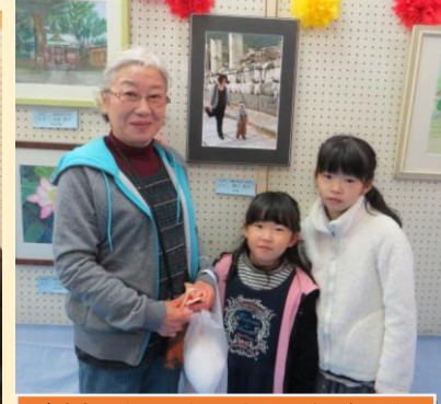
応援団も駆けつけてくれました(〇)／