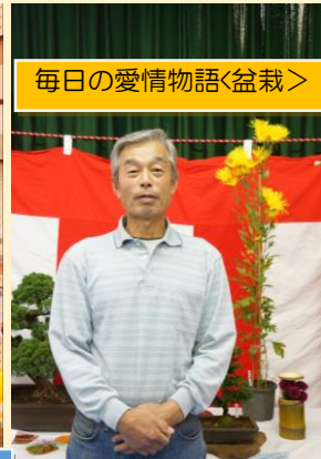
毎日の愛情物語<盆栽>