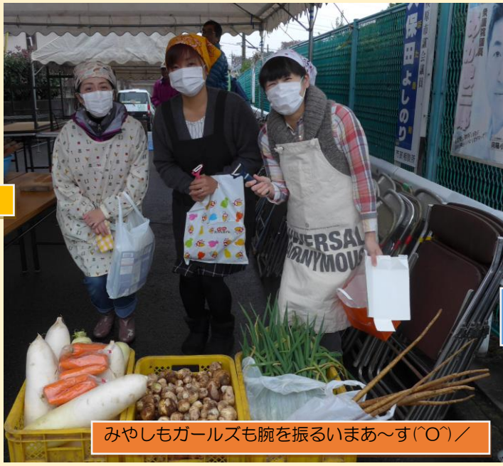
みやしもガールズも腕を振るいまあ〜す(〇)／