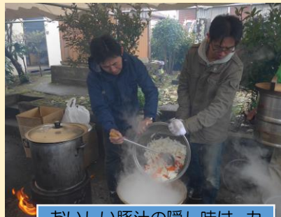
おいしい豚汁の隠し味は、カ仕事なんです。