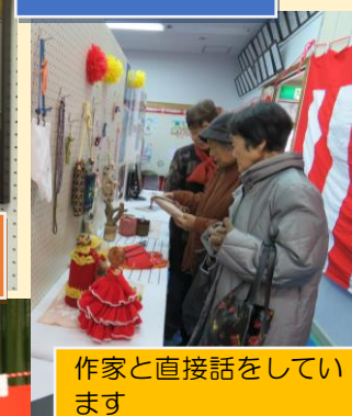
作家と直接話をしています