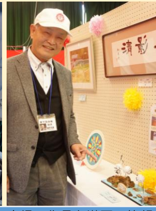
自慢の作品と満面の笑顔(≧▽≦)