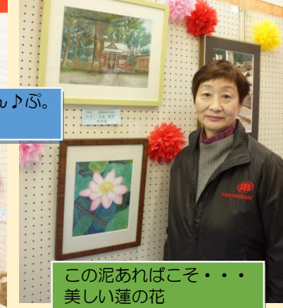
この泥あればこそ・・・美しい蓮の花