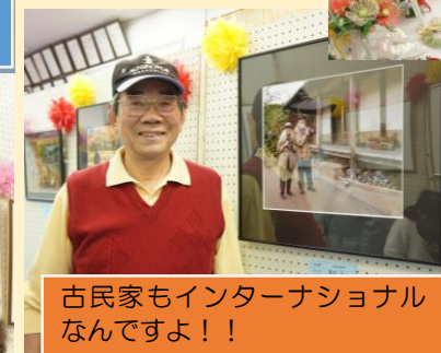
古民家もインターナショナルなんですよ！！