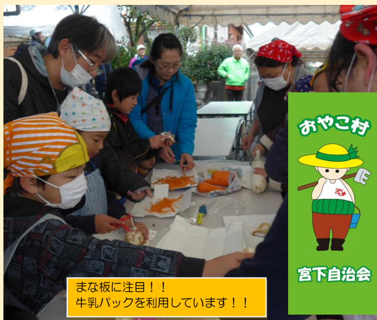
まな板に注目！！牛乳パックを利用しています！！