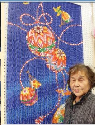
なんと！ピースの手毬暖簾です！！