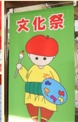
宮じっさんも文化祭仕様に衣替え