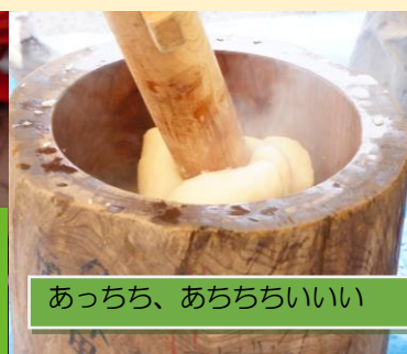
あっち、あちちいいい お母さんのやさしい手に包まれて・・・