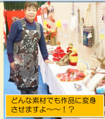
どんな素材でも作品に変身させますよ〜！？