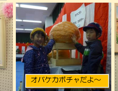
オバケカボチャだよ〜