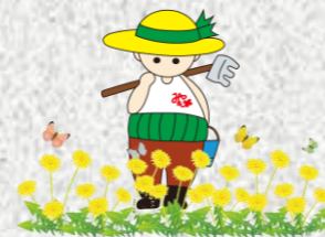
マスコットキャラクター 宮自っさん