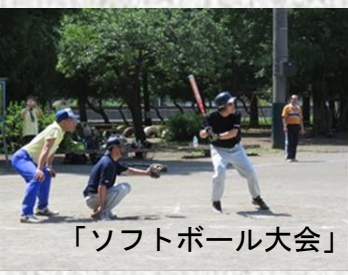
「ソフトボール大会」