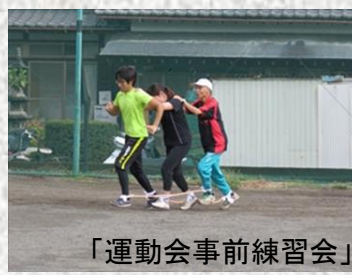
「運動会事前練習会」