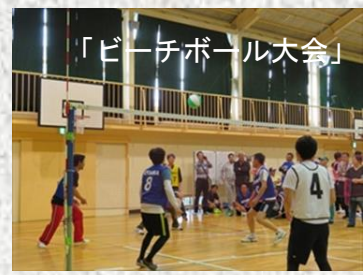
「ビーチボール大会」

ソフトボール大会・野球大会等の選手の固定が本年度より、概ね選定可能その他の球技も選手候補が確定しつつあります。年間を通しては、上々の成果が挙げられた1年だと思えます。