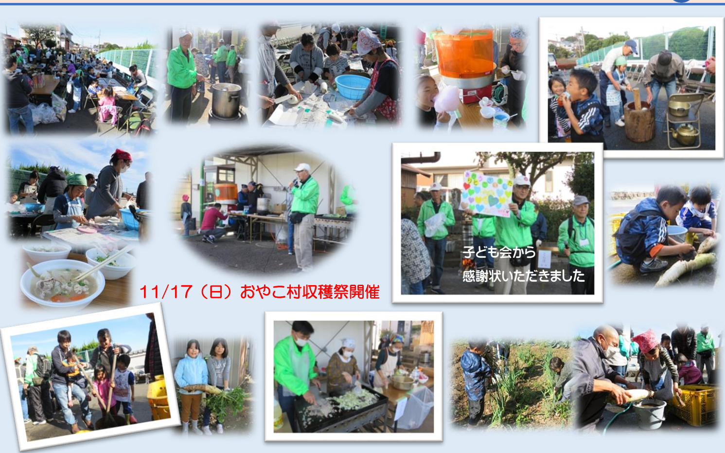
11/17(日) およこ村収穫祭開催