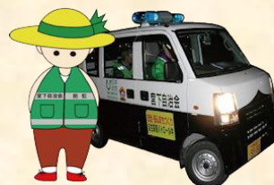
マスコットキャラクター 宮自っさん