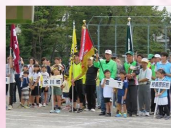
9月小山公民館区運動会