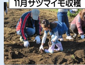
11月サツマイモ収穫