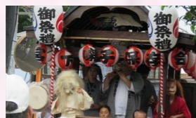
7月夏祭り納涼大会