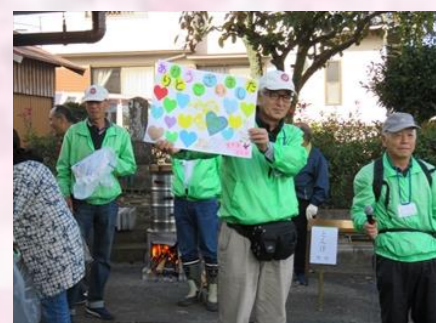
11月おやこ村収穫祭

現在7名の方を27名で見守って頂いているのが現状です。11月に見守り対象者に呼びかけの為パンフレットを各戸配布いたしました。尚、12月に見守って頂いている方との懇談会を開催致しました。小山高齢者支援センターからも参加頂き、出席者からは見守っている現状報告等活発なご意見を頂き来年への参考とさせていただきます。