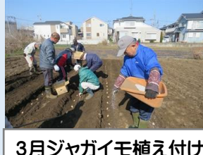
3月ジャガイモ植え付け