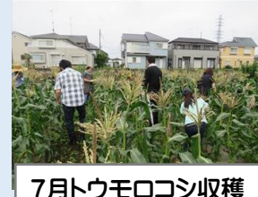
7月トウモロコシ収穫