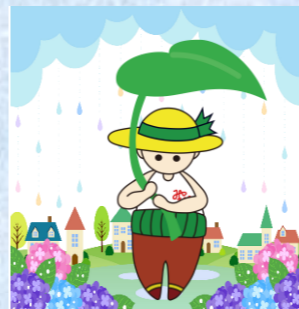
マスコットキャラクター 「宮自っさん」梅雨 Ver.