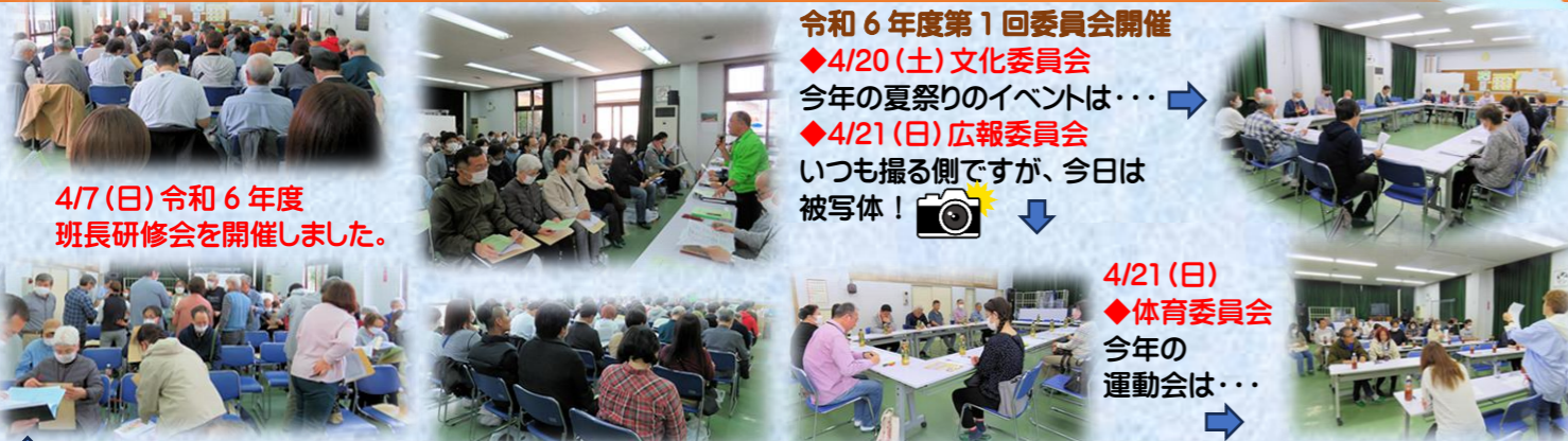
4/7(日)令和6年度 班長研修会を開催しました。

令和6年度第1回委員会開催 ◆4/20(土)文化委員会 今年の夏祭りのイベントは… ◆4/21(日)広報委員会 いつも撮る側ですが、今日は被写体！