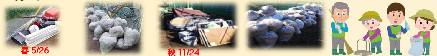
春 5/26 粗大ごみと一般ごみ(約50袋)

環境委員会は宮下自治区域内がきれいで住みやすい環境を維持することを目的としています。活動の最大の行事は春と秋のクリーンキャンペーン。子供たちが遊ぶ境川跡地公園(三角公園)や、もみの木広場の清掃や植栽整理のメンテナンス、町内全体の放置自転車や不法投棄物を一斉回収し、行政と連携し廃棄しています。ごみ収集所の整備や相談なども随時受け付けています。自治会最大のイベント夏祭りの運営にも参加。宮下自治会区域内の生活環境がより良くなるよう活動してゆきます。