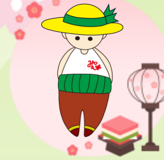
マスコットキャラクター「宮っさん」

★自治会へのご要望等・お問い合わせ先 mail: info@miyashimojichikai.com